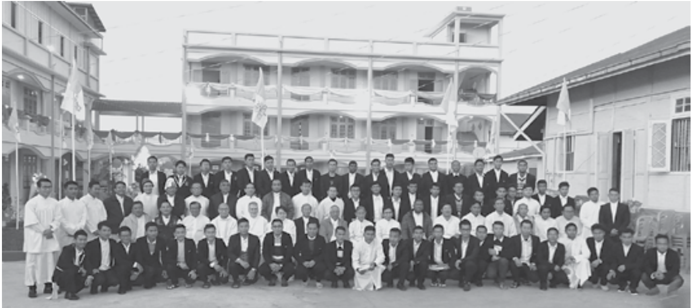
အလှူရှင်များ၊ ဆရာတော်ကြီးများနှင့် ရဟန်းဖြစ်တက္ကသိုလ် ရှိစာချရဟန်းများနှင့် စာသင်သားများအား ကျောင်းဆောင်အသစ်ရှေ့၌ တွေ့ရစဉ်

ပြင်ဦးလွင်မြို့ မြန်မာတစ်နိုင်ငံလုံးဆိုင်ရာ ကက်သလစ်ရဟန်းဖြစ်သင် တက္ကသိုလ် ဒဿနိကဗေဒ ဌာနတွင် ကျောင်းဆောင် သစ်တစ်ဆောင်ကို ဇန်နဝါရီလ ၁၆ ရက်နေ့က တိုးချဲ့ဖွင့်လှစ်နိုင်ခဲ့ပြီဖြစ်သည်။