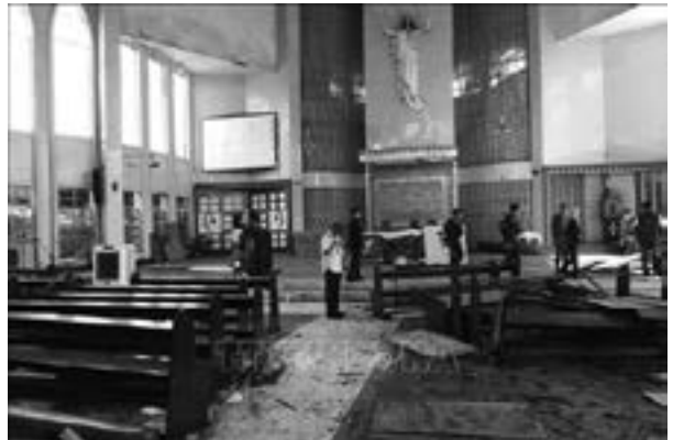
မြန်မာနိုင်ငံကက်သလစ်ဆရာတော်ကြီးများအဖွဲ့ချုပ် - လူထုဆက်သွယ်ရေးရုံး

စစ်တပ်၏ ဖော်ထုတ်ချက်အရ ဒုတိယ ဖောက်ခွဲရေး ပစ္စည်းမှာ အနီးနားတွင် ရပ်ထားသည့် ဆိုင်ကယ်နှင့်