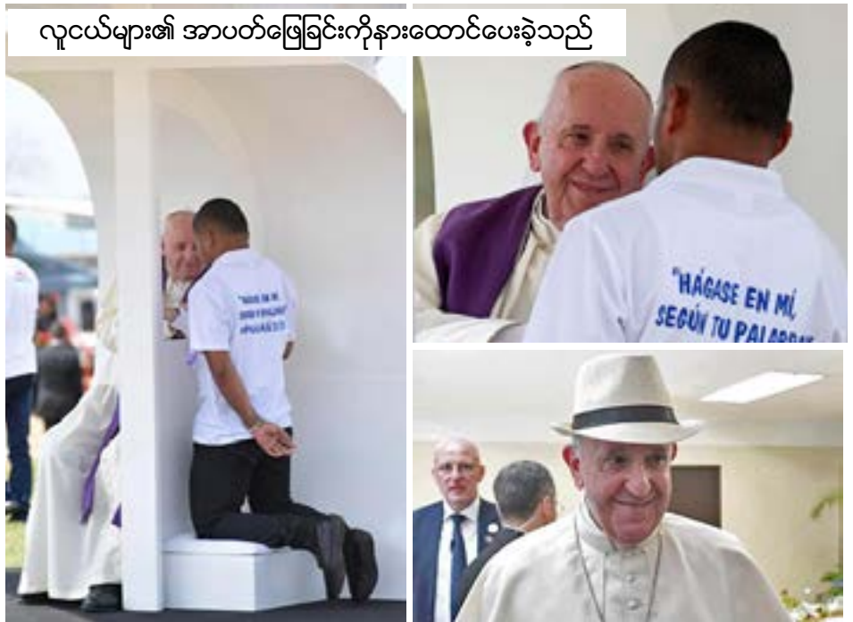
လူငယ်များ၏ အာပတ်ဖြေခြင်းကိုနားထောင်ပေးခဲ့သည်