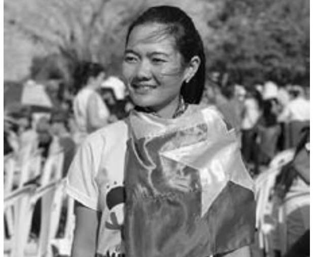
ဒါပထမဦးဆုံးလား။

မေး ။ ။ World Youth Day မှာ ပါဝင်တာ ညီမအတွက်