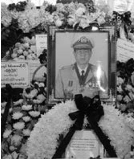
ဖွားခဲ့ပြီး ကက်သလစ် ခရစ်ယာန် ဘာသာဝင်တစ်ဦးဖြစ်သည်။

စစ်အစိုးရ လက်ထက် မြန်မာ့ စီးပွားရေး အကြီးအကဲအဖြစ် ဝန်ကြီးရာထူး အမျိုးမျိုး တာဝန် ထမ်းဆောင်ခဲ့သော ဗိုလ်မှူးချုပ်ဖောဝင်း အေဘယ်လ်သည် ဇန်နဝါရီလ ၂၀ ရက်နေ့က ရန်ကုန်တွင် နှလုံးရောဂါဖြင့် ကွယ်လွန်သွားခဲ့ပြီဖြစ်သည်။ ကွယ်လွန်ချိန်တွင် အသက် ၈၄ နှစ်ရှိပြီဖြစ်သည်။