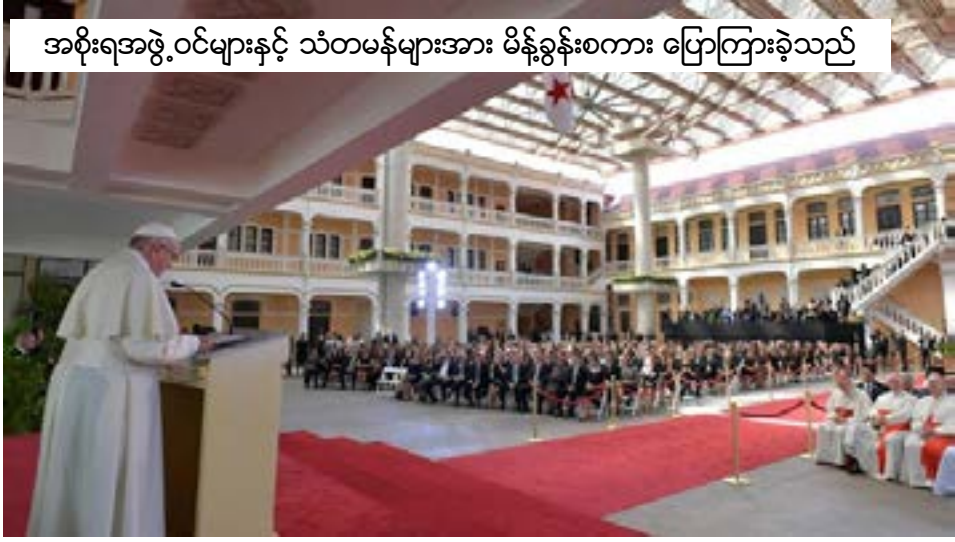
အစိုးရအဖွဲ့ဝင်များနှင့် သံတမန်များအား မိန့်ခွန်းစကား ပြောကြားခဲ့သည်