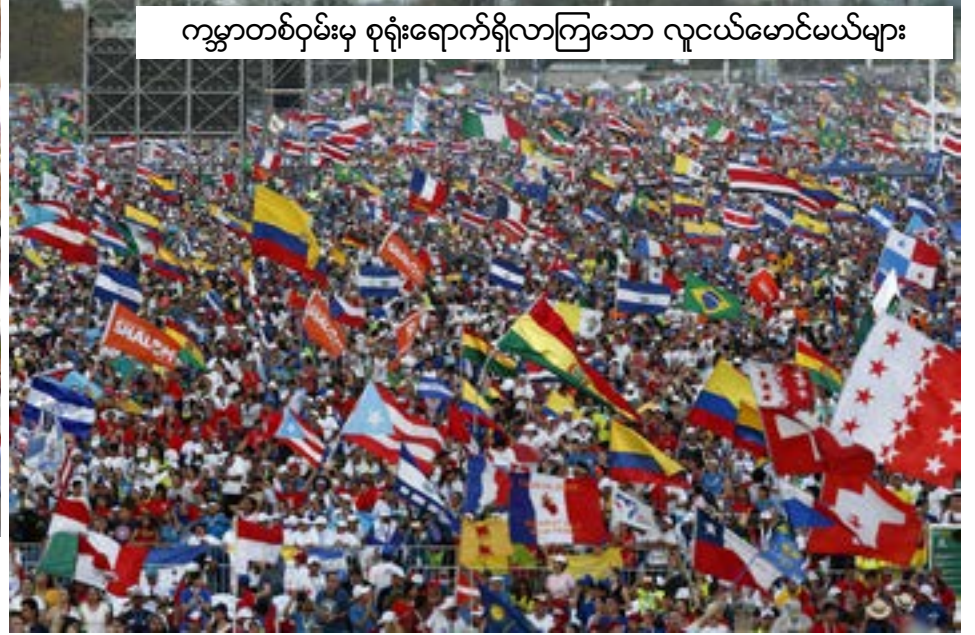
ကမ္ဘာတစ်ဝှမ်းမှ စုရုံးရောက်ရှိလာကြသော လူငယ်မောင်မယ်များ