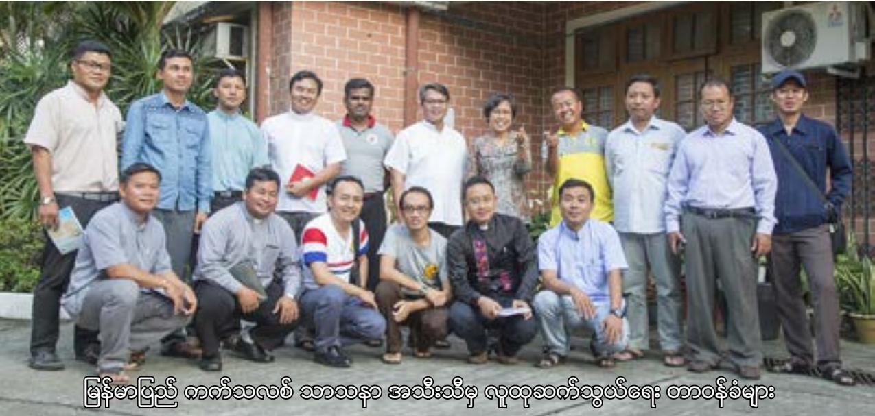
မြန်မာပြည် ကက်သလစ် သာသနာ အစိုးရဆိုင်ရာ လူထုဆက်သွယ်ရေး တာဝန်ခံများ

မြန်မာနိုင်ငံလုံးဆိုင်ရာ ကက်သလစ် ဆရာတော်ကြီးများ အဖွဲ့ချုပ် လူထုဆက်သွယ်ရေး ကော်မရှင်၏ နှစ်ပတ်လည် အစည်းအဝေးကို ၂၀၁၉ ခု ဇန်နဝါရီလ ၁၀-၁၁ ရက်များတွင် ရန်ကုန်မြို့ ဆရာတော်ကြီးများအဖွဲ့ချုပ် ကျောင်းတိုက် လူထုဆက်သွယ်ရေး ရုံးခန်းတွင် ကျင်းပပြုလုပ်ခဲ့သည်။ နိုင်ငံတကာအဖွဲ့အစည်းဖြစ်သော SIGNIS အသင်းတွင် စနစ်တကျ ပါဝင် နိုင်ရေးအတွက် SIGNIS MYANMAR ဘုတ်အဖွဲ့ကို ဖွဲ့စည်းနိုင်ခဲ့သည်။ လူထုဆက်သွယ်ရေး နည်းစနစ်များကို ကျင့်သုံးခြင်းဖြင့် သတင်းကောင်း ဖြန့်ဝေခြင်း၊ အသိပညာပေးခြင်း၊ ဖျော်ဖြေ ခြင်းလုပ်ငန်းစဉ်များကို အကောင်အထည်ဖော်နိုင်ရန်၊ တွေ့ကြုံနေရသည့် စိန်ခေါ်မှုများအား ကျော်လွှားနိုင်ရန် နည်းလမ်းများ ရှာဖွေခြင်းတို့ကို လုပ်ဆောင်ခဲ့ကြသည်။