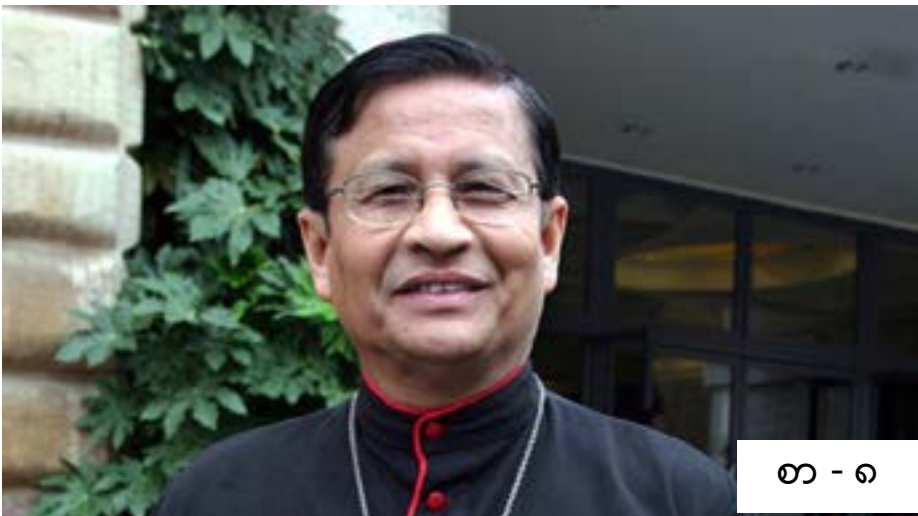
စာ - ၈

မြစ်ဆုံ ရေကာတာ ဆောက်လုပ်ခြင်းကို အပြီးအပိုင် ရပ်တန့်ရေး ဝိုင်းဝန်း လှုပ်ထောင့်ကြရန် ကာဒ်နယ်များလိပ်ဆို၏ ဆက်လက်လွှာ