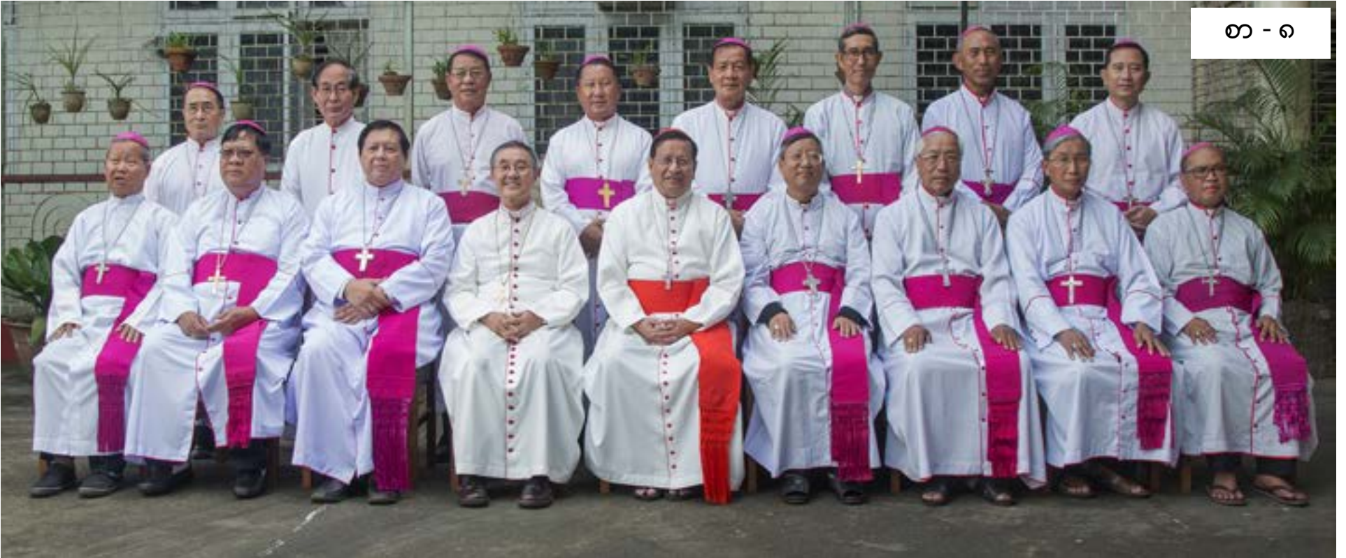
စာ - ၈

မြန်မာနိုင်ငံကက်သလစ်ဆရာတော်ကြီးများအဖွဲ့ချုပ် CBCM ၏ ၂၀၁၉-ခုနှစ်၊ ပထမ(၆)လပတ် မျက်နှာစုံညီအစည်းအဝေး