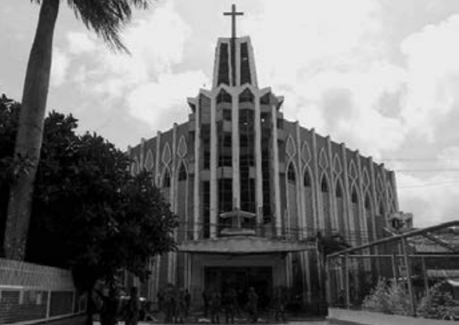
ပြောဆိုခဲ့သည်။

"တိုင်းပြည်ရဲ့ ရန်သူတွေဟာ ပြည်သူတွေရဲ့ အသက် အိုးအိမ်ကိုကာကွယ်တဲ့နေရာမှာ အစိုးရရဲ့ စွမ်းဆောင်မှုကို စိန်ခေါ်ခဲ့တယ်။ ဖိလစ်ပိုင်တပ်မတော်ဟာ ဒီဘုရားမဲ့တဲ့ ရာဇဝတ်သားတွေကို ချေမှုန်းသွားမယ်" ဟု သမ္မတရုံးက