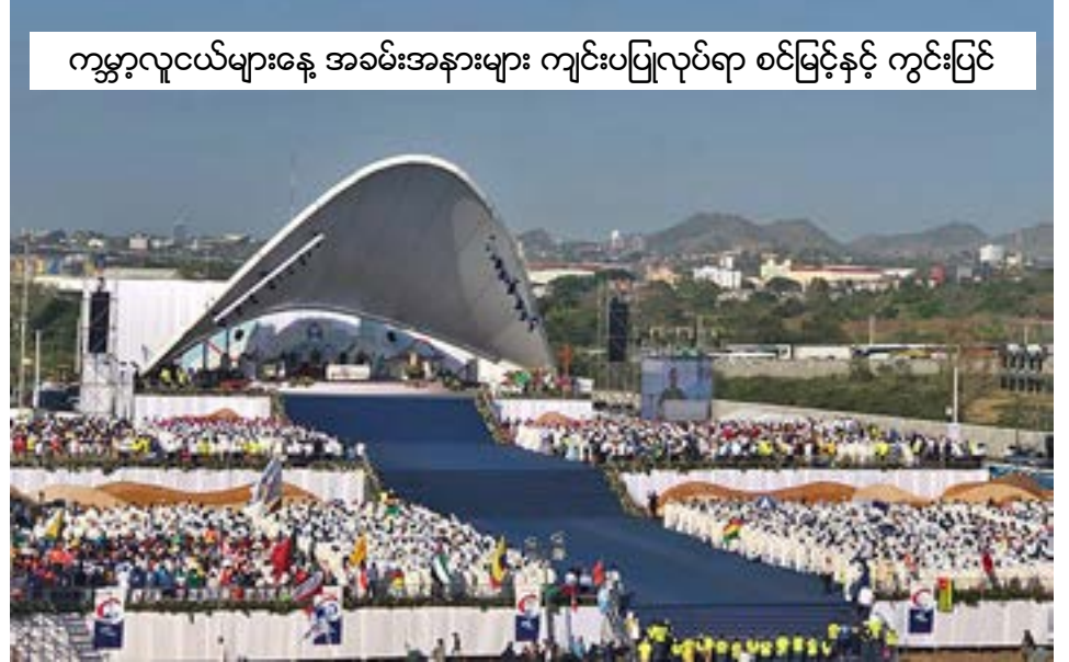
ကမ္ဘာ့လူငယ်များနေ့ အခမ်းအနားများ ကျင်းပပြုလုပ်ရာ စင်မြင့်နှင့် ကွင်းပြင်

ကမ္ဘာ့လူငယ်များနေ့၏ အပိတ်မိန့်တရားတော်မြတ်ကို ဇန်နဝါရီ ၂၇ ရက်နေ့တွင် ကျင်းပခဲ့ရာ လူထု ပရိတ်သတ် ၇ သိန်းခန့် ပါဝင်တက်ရောက်ခဲ့သည်။