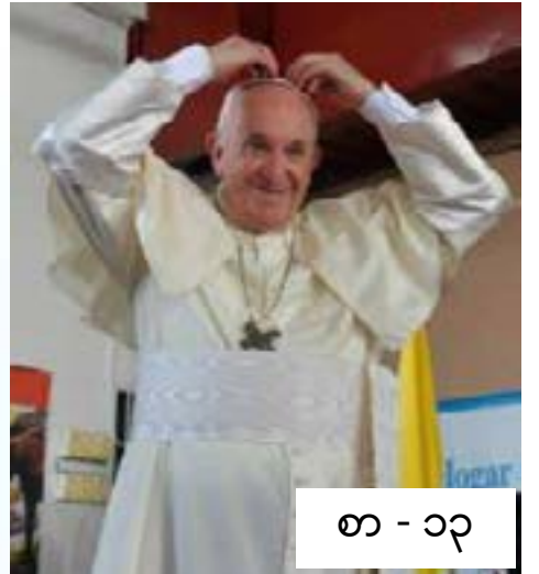
စာ - ၁၃

မြန်မာနိုင်ငံကက်သလစ်ဆရာတော်ကြီးများအဖွဲ့ချုပ် CBCM ၏ ၂၀၁၉-ခုနှစ်၊ ပထမ(၆)လပတ် မျက်နှာစုံညီအစည်းအဝေး