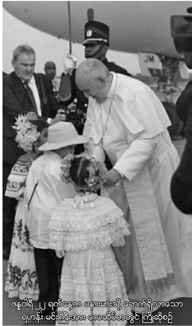
ဇန်နဝါရီ ၂၂ ရက်နေ့စာ ဖုတ်ရဟန်းမင်းကြီး ဖရန်စစ် နှင့် ခရီးစဉ် အစောဆုံးအစည်းအဝေး အစည်းအဝေးတွင် တွေ့ဆုံရခြင်း

ရည်ရွယ်ချက်မှာ သာသနာပြု အဓိကက်သလစ် အသင်း တော်၏ လိုအပ်ချက်များအား အချိန်နှင့် တပြေးညီ တုန့်ပြန် ဆောင်ရွက် ပေးမည့် ဗာတီကန် အုပ်ချုပ်ရေး အဖွဲ့ ပေါ်ပေါက်လာရေး အတွက် ပံ့ပိုးပေးရန် ဖြစ်သည်။