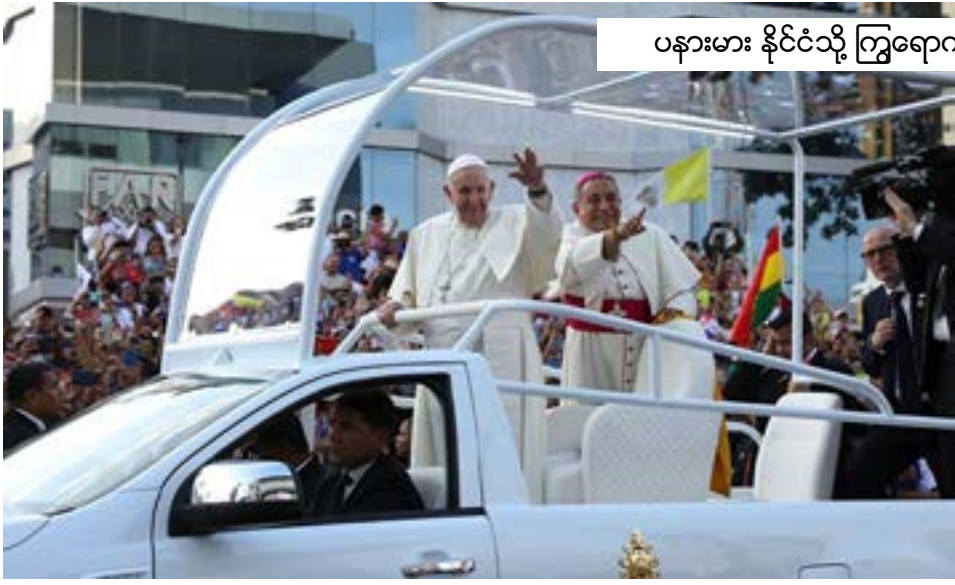
ပနားမား နိုင်ငံသို့ ကြွရောက်လာသော ပုပ်ရဟန်းမင်းကြီးအား သောင်းသောင်းယူယူ ခရီးဦးကြိုပြုခဲ့ကြသည်