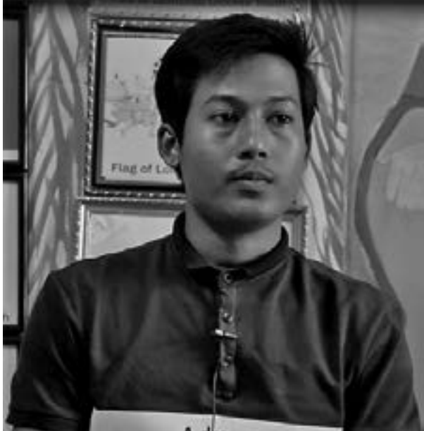
မြန်မာနိုင်ငံကက်သလစ်ဆရာတော်ကြီးများအဖွဲ့ချုပ် - လူထုဆက်သွယ်ရေးရုံး

ဟုတ်ကဲ့ပါ ဒီမြန်မာပြည်မှာရှိတဲ့ လူငယ်မောင်မယ် အပေါင်း ပြီးတော့သာသနာအသီးသီးမှာရှိတဲ့ Youth Director အားလုံးကိုပေါ့နော် အခုသွားမယ့် ကျွန်တော်တို့ ၁၀ ယောက်၊ CBCM ရဲ့ ကိုယ်စားပြု၊ မြန်မာနိုင်ငံ Catholic Youth commission ရဲ့ ကိုယ်စားပြု ဒီ ၁၀ ယောက် အတွက် ဆုတောင်းပေးပါလို့။ လမ်းခရီးအစဉ်ပြေအောင်၊ ရောက်တဲ့အခါမှာလည်း ကျွန်တော်တို့ မြန်မာ စိတ်ဓာတ်ကိုအကောင်းဆုံး ပြသနိုင်တဲ့ ၁၀ ဦးဖြစ်ဖို့ သည်းခံခြင်း၊ နိမ့်ချခြင်း၊ စိတ်ရှည်ခြင်းတွေကို ကျွန်တော်တို့ တခြားနိုင်ငံတွေနဲ့ ဆုံတဲ့အခါမှာ ပြသနိုင်ဖို့ အိမ်ရှင်နိုင်ငံပန်းမားနဲ့ ဆုံတွေ့တဲ့အခါမှာလည်း သူတို့ရဲ့ အစဉ်မပြေမှုသော်လည်းကောင်း၊ သူတို့ရဲ့ အားနည်းချက်ကိုသော်လည်းကောင်း ကြိုဆိုတဲ့အခါမှာမညည်းမညူဘဲနဲ့ နိမ့်ချခြင်းနဲ့ ကိုယ့်စိတ်တွေကိုထားရှိနိုင်ဖို့၊ ကျေးဇူးတော်ကိုရရှိဖို့ အထူးသဖြင့် ဒီအဖွဲ့က မြန်မာပြည်ရဲ့ ကိုယ်စားဖြစ်တဲ့ အတွက် မြန်မာ့အမည်ကို မဖျက်ဘဲနဲ့ အကောင်းဆုံးဖော်ဆောင်နိုင်တဲ့ ၁၀ ယောက်ဖြစ်ဖို့ပေါ့နော် ဝိုင်းဝန်း ဆုတောင်းပေးပါလို့။ လမ်းခရီးလည်း အစဉ်ပြေဖို့ ဆုတောင်းပေးပါလို့။ ကျေးဇူးတင်ပါတယ်။