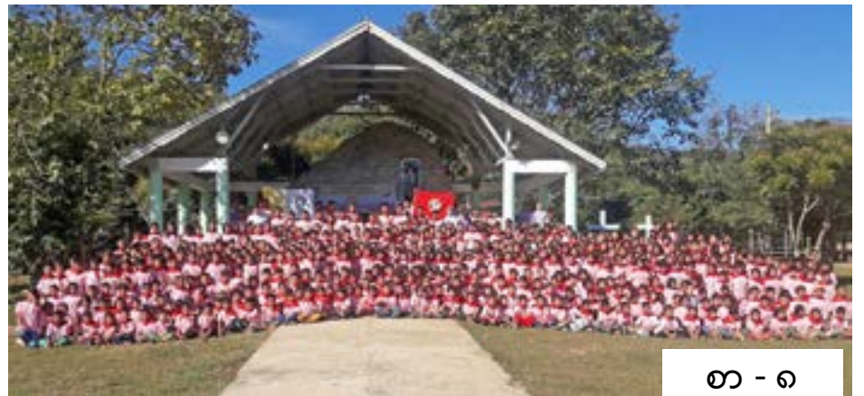
စာ - ၈

မြစ်ဆုံ ရေကာတာ ဆောက်လုပ်ခြင်းကို အပြီးအပိုင် ရပ်တန့်ရေး ဝိုင်းဝန်း လှုပ်ထောင့်ကြရန် ကာဒ်နယ်များလိပ်ဆို၏ ဆက်လက်လွှာ