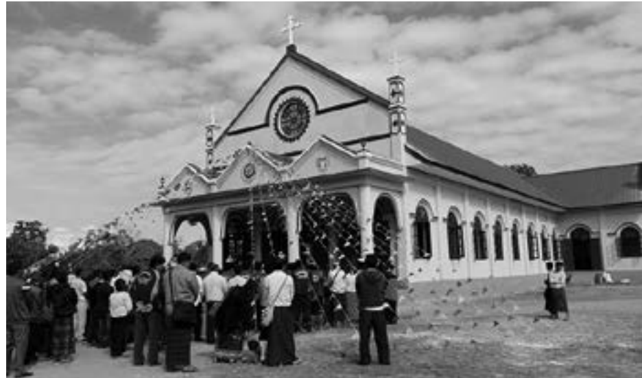
ဖန်ဆင်း ထားသည့် ရည်ရွယ်ချက်မှာ ကျွန်ုပ်တို့နှင့်အတူ အနီးကပ်ရှိနေရန် မျှော်လင့် ပါကြောင်း ထပ်လောင်း မြွက် ကြားခဲ့သည်။

ဆက်လက်၍ ဆရာတော်ဘုရားမှ ဤ စိန်ပေတရူး ဘုရားကျောင်း ဆောက်နိုင်ခြင်း သည် ဘုရားသခင်ပေးသည့် ဆုကျေးဇူးပင် ဖြစ်ကြောင်း၊ ကိုယ်ထူကိုယ်ထ စွမ်းအားကို ထီးလင်းဘုရားကျောင်းသည် သက်သေထူနေကြောင်း၊ ဘုရားကျောင်းရှိသည့်ရွာနှင့် မရှိ သည့်ရွာသည် အင်မတန် ခြားနားပါကြောင်း၊ ဘုရားကျောင်းဆိုသည်မှာ ယေဘုယျအားလုံးတရား ဟောကြား တော်မူသည့် နေရာဖြစ်ကြောင်း နှင့် ဘုရားသခင်သည် ကျွန်ုပ်တို့လူသားများကို